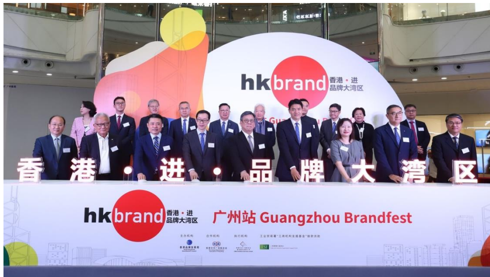
一众香港和广州市政府官员及商界代表主持开幕仪式