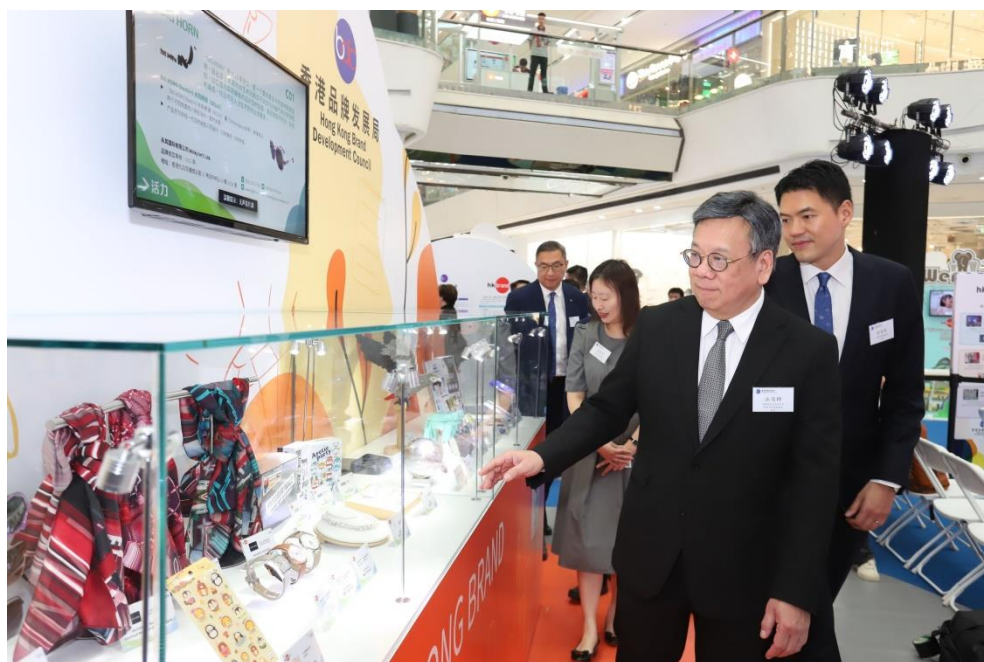
“品牌形象展示区”展出 50 多个香港品牌旗下 150 多件产品