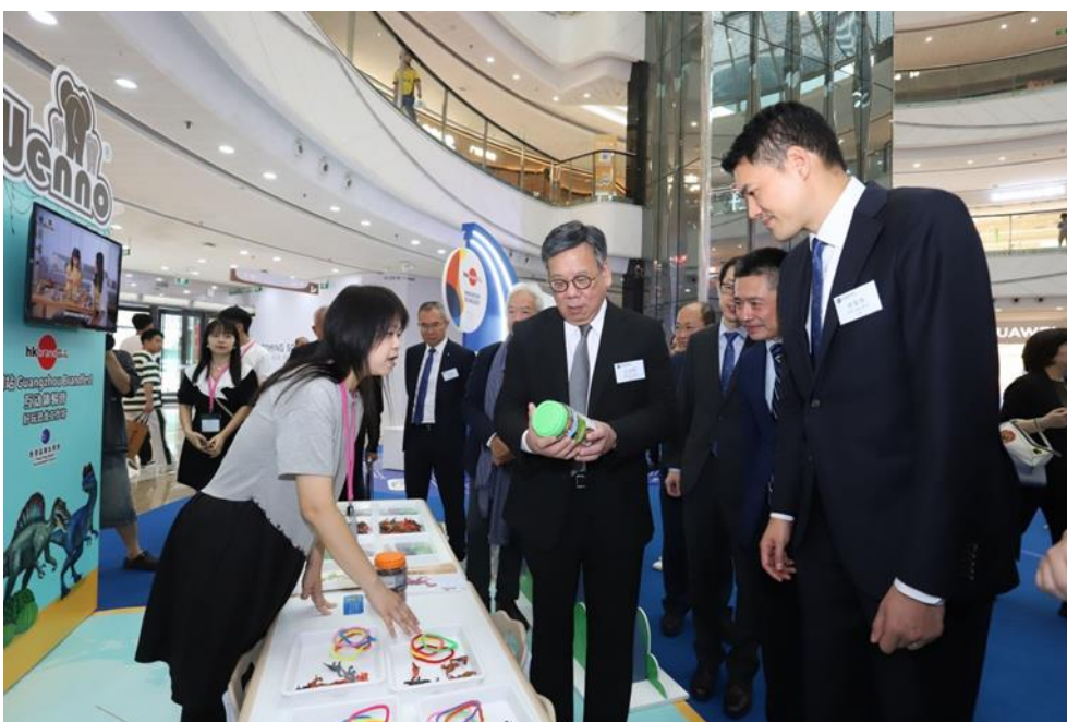
展示区内设置“4M STEAM 创意科普亲子工作坊”、“佳宁娜造饼体验工作坊”及“维亮好玩恐龙工作坊”互动体验营