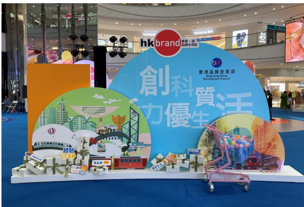
现场设有多个打卡点